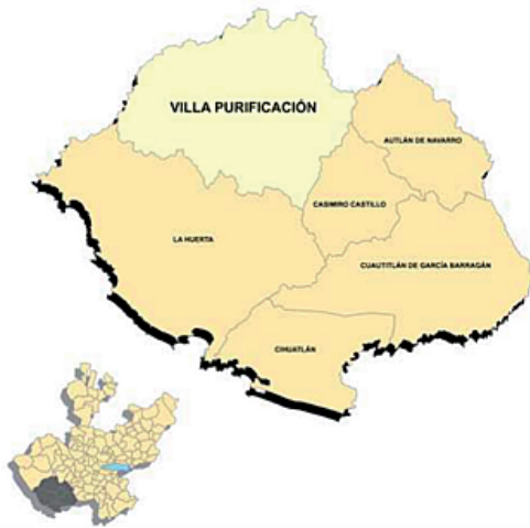
Figura 1. Villa Purificación, Jalisco. Localización geográfica.

Ante un panorama de degradación ambiental poco alentador y con situaciones tales como la escasez de agua, la pérdida de la biodiversidad, de los bosques y las selvas, y la contaminación, entre muchos otros problemas, se hace evidente la necesidad de lograr una ciudadanía que tenga las competencias para enfrentar estos retos y encontrar soluciones.